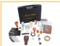
Kits de Inspección Elcometer

La nueva versión de el medidor de espesor de revestimientos Elcometer 456 ahora cuenta con una pantalla mas amplia para facilitar la visibilidad y con una función para su fácil calibración agilizando así las pruebas.