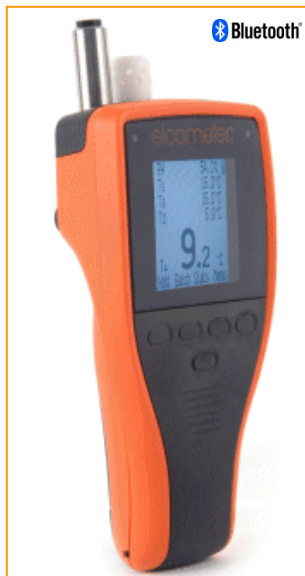
Medidor de Punto de Rocío Elcometer 319 con Bluetooth ®†